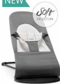
Gris Oscuro/Gris Cotton/Jersey 005084