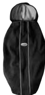
Funda polar para todas las mochilas Negro 028056