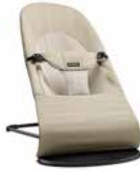
Caqui/Beige Algodón, 005026