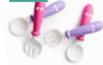
Rosa/Lila 4p 073046