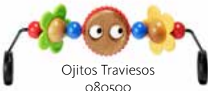
Ojitos Traviesos 080500