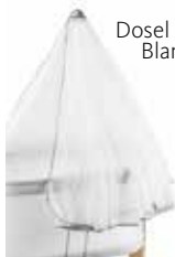
Dosel para Minicuna Blanco 042021

El dosel suaviza y tamiza la luz, haciendo que la minicuna sea un lugar seguro y tranquilo para dormir. Hecho de un fino tejido de red y bien ventilado.