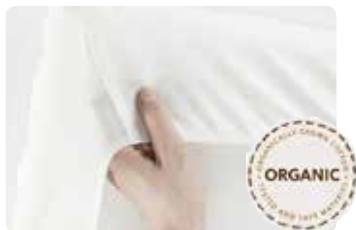
Blanco ecológico, Organic 043035