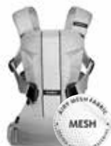
Plata Mesh, 093004