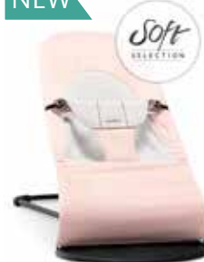
Rosa Claro/Gris Cotton/Jersey 005089