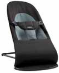
Negro/Gris Oscuro Algodón, 005022