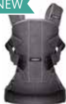
Vaquero Gris Cotton Mix 093094