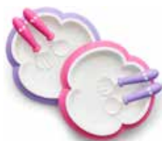
Lila/Rosa 2-pack 074046