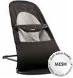
Negro/Gris Mesh, 005028