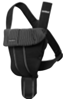
Negro Milrayas Algodón, 023020