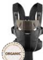
Negro/Marrón Organico, 096047