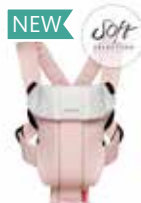
Rosa Claro/Gris Soft, 023089