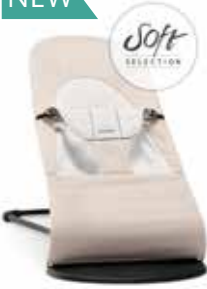
Beige/Gris Cotton/Jersey 005083