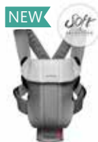
Gris Ocuero/Gris Soft, 023084