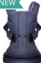
Vaquero Azul Cotton Mix 093093