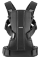
Negro Algodón, 092044