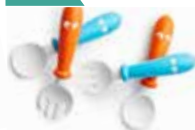
Naranja/Turquesa 4p 072105