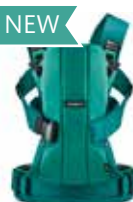
Esmeralda/Verde Algodón, 092099