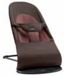
Marrón Algodón, 005030