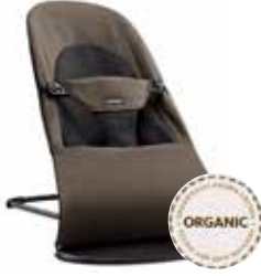
Negro/Marrón Orgánico, 005027