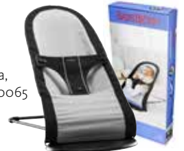
Negro/Plata, Cotton Mix 010065