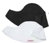
Babero para Original y Miracle Negro 031076 Blanco 031021