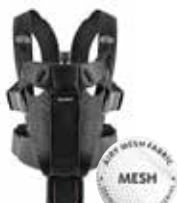
Negro Mesh, 096002