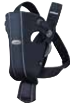
Azul Oscuro, Algodón, 023051