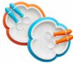
Naranja/Turquesa 2-pack 074082