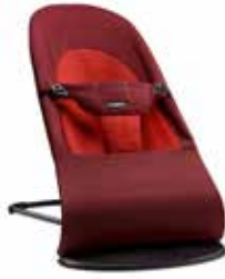
Óxido/Naranja Algodón, 005024