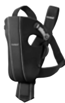
Negro Algodón, 023056