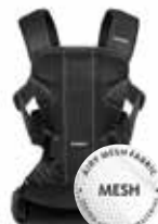
Negro Mesh, 093025