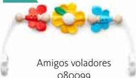
Amigos voladores 080099