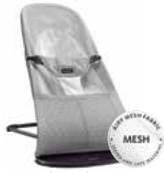
Gris claro/Blanco Mesh, 005029