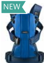
Cobalto/Azul Algodón, 092097