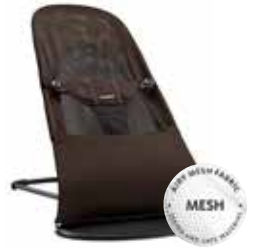
Negro/Marrón Mesh, 005006