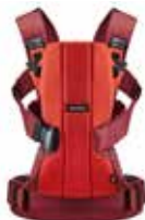
Naranja/Óxido Algodón, 092032