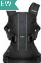
Negro Cotton Mix 093023