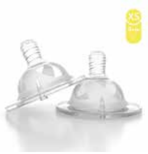
XS 0+M 78081