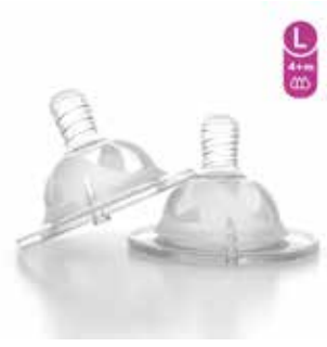
L 4+m 78021