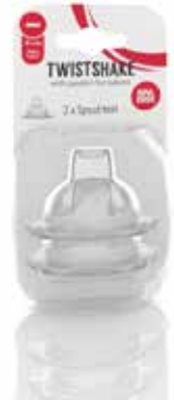
Spout 4+M 78079