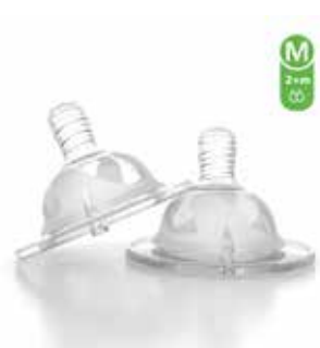
M 2+M 78020