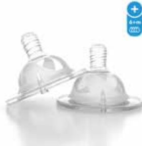
Plus 6+M 78022