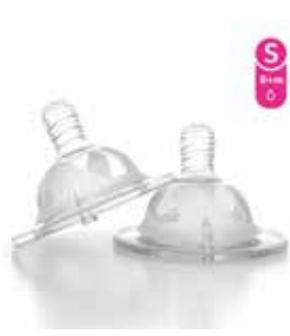
S 0+M 78019