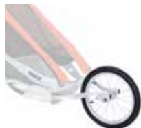
Kit running para Chariot Cougar1/Cheetah1 20100143 Jog Kit para Chariot Cougar2/ Cheetah2 20100144