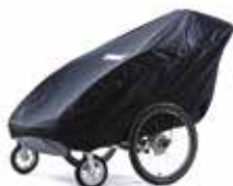
Cubierta almacenamiento 20100784