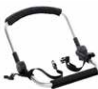
Adaptador sillas auto 20110713