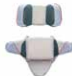
Soporte bebé 20101001