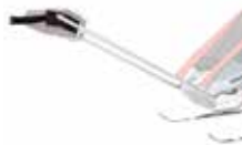
Kit esquí y trekking 20100808