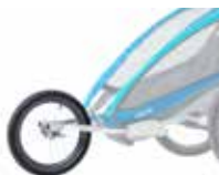
Kit running para CX 1 20100157