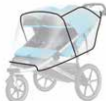
Protector de lluvia 20110718