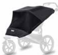
Protectora de red 20110719