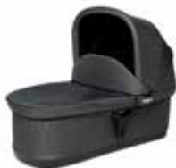
Capazo Urban Glide/Glide 20110724