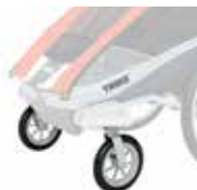
Kit paseo para Chariot, CX 1, CX 2y Cougar 1 y 2 20100209