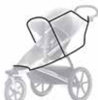
Protector de lluvia 20110714