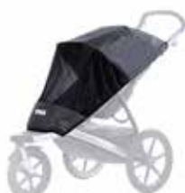
Protectora de red 20110715