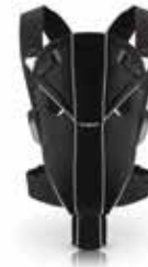
BABYBJÖRN Mochila Porta Bebé Miracle