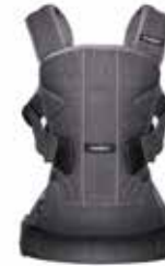
BABYBJÖRN Mochila Porta Bebé ONE