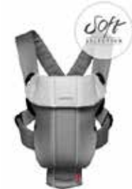
BABYBJÖRN Mochila Porta Bebé Original