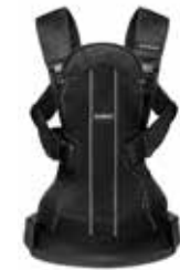
BABYBJÖRN Mochila Porta Bebé WE