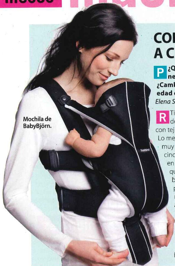
Mochila de BabyBjörn.