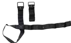
Correas de sujeción inferiores

La cuña ayuda a rellenar el hueco entre la silla de seguridad y el asiento del vehículo donde va instalada la silla, cuando este último es muy inclinado. Válida para todos los modelos.