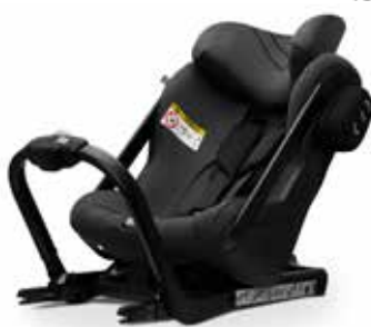
Axkid One Granite Melange 25110021