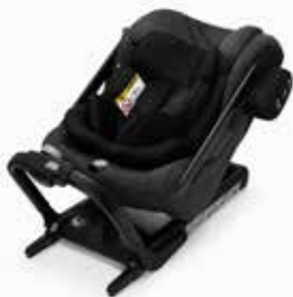
Axkid One+ Granite Melange 25120021