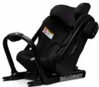
Axkid One Black 25110016