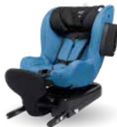
Azul Petróleo, 24100011