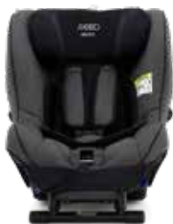
Granite Grey 22140217