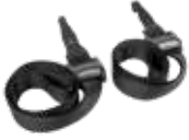
Correas de fijación para Axkid Move 800203

Evitan el efecto rebote en un posible accidente.