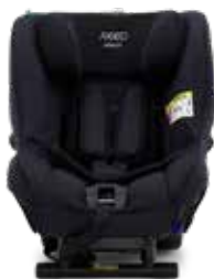
Tar Black 22140216