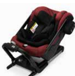
Axkid One+ Tile Melange 25120025