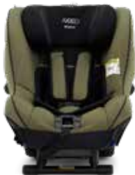
Moss Green 22140220