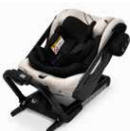
Axkid One+ Brick Melange 25120024