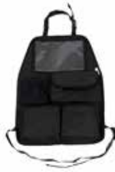
Organizador Funda asiento 804103

Evitan el efecto rebote en un posible accidente.