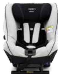
Sky Grey 22140223