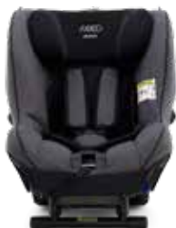
Granite Grey Melange 22140222