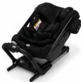
Axkid One+ Black 25120016