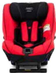
Sellfish Red 22140218