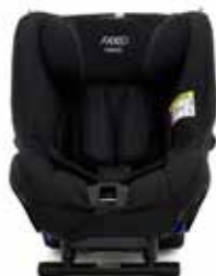
Shell Black 22140221