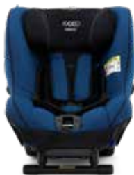
Sea Blue 22140219