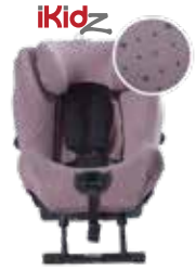
Funda iKidz Z301031

Protector solar para la ventana trasera.