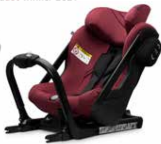
Axkid One Tile Melange 25110025