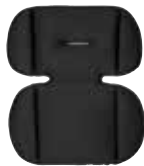
Cojín adaptador para sillas