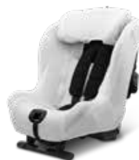
Funda de verano Bamboo

Te permite ver a tu hijo en el asiento trasero del coche durante el viaje. Se sujeta al reposacabezas del coche.