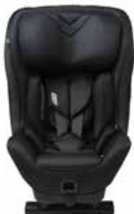
Shell Black 22150121