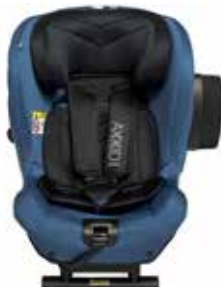
Sea Blue 22140319