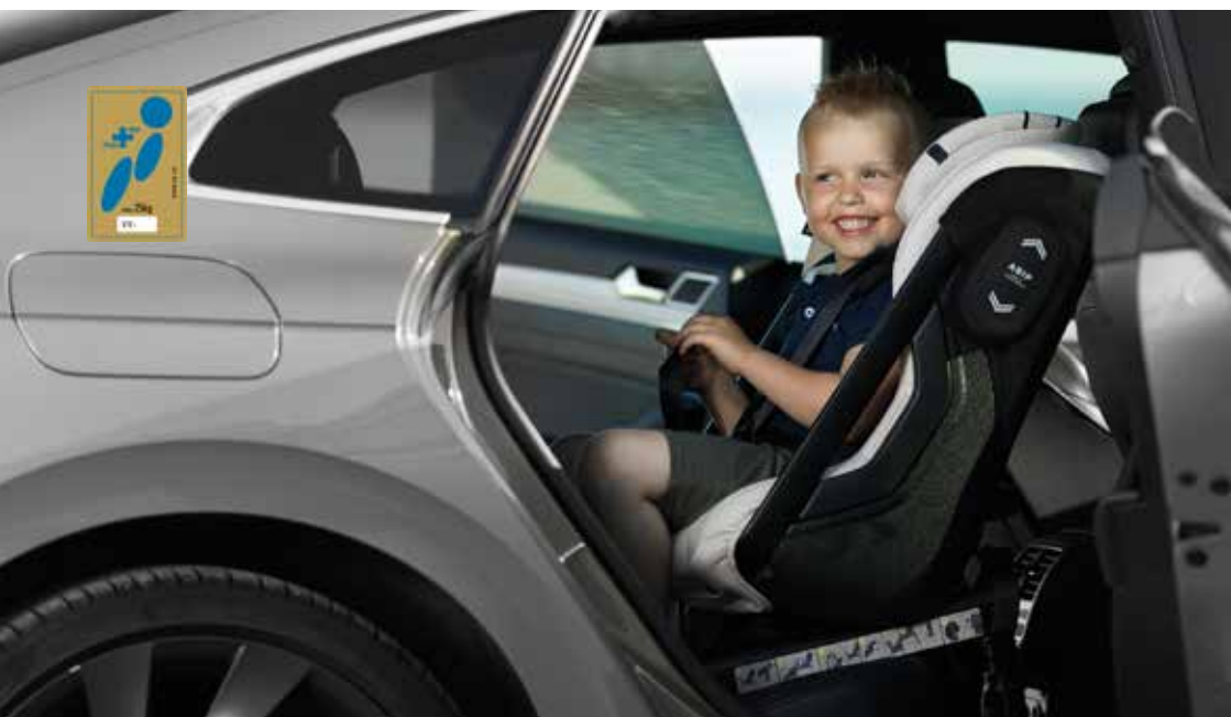
Axkid One+ Black 25120016