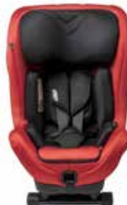
Shellfish red 22140318