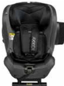
Granite Melange 22140317