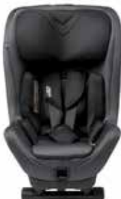
Granite Grey 22150117