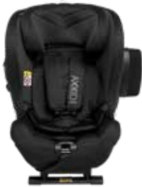
Shell Black 22150121