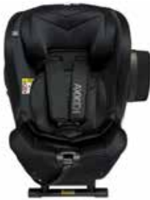
Tar Black 22140316