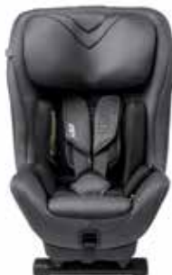
Granite Melange 22150117