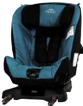
Azul Petróleo, 260311