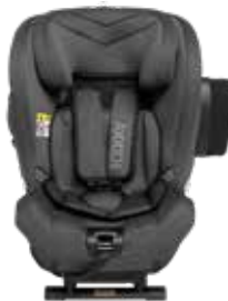
Gray Melange 22140322