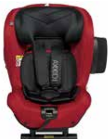
Shellfish red 22140318