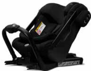
Axkid One Black 25110016