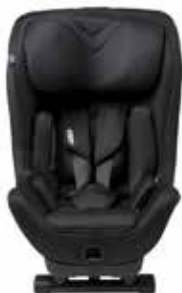
Tar Black 22150116