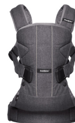
BABYBJÖRN Mochila Porta Bebé ONE