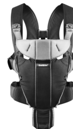
BABYBJÖRN Mochila Porta Bebé Miracle