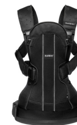
BABYBJÖRN Mochila Porta Bebé WE