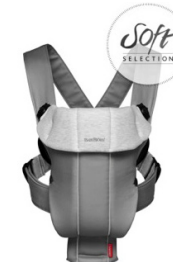
BABYBJÖRN Mochila Porta Bebé Original