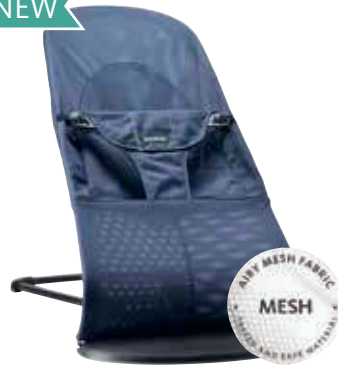
Gran Ballena Azul Cotton/Jersey 005008