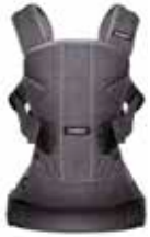
Vaquero Gris Cotton Mix, 093094