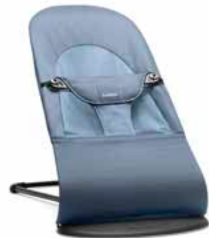
Azul Niebla Algodón, 005074