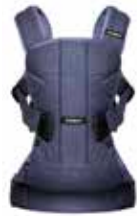
Vaquero Azul Cotton Mix, 093093