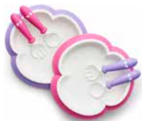
Lila/Rosa 2-pack 074046