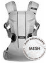
Plata Mesh, 093004