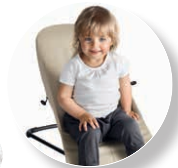
3,5 - 13 kg. (0-2 años)