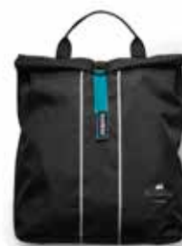
Bolsa para Mochila incluida