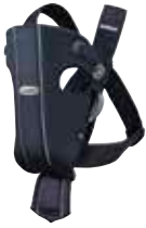
Azul Oscuro, Algodón, 023051