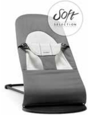
Gris Oscuro/Gris Cotton/Jersey 005084