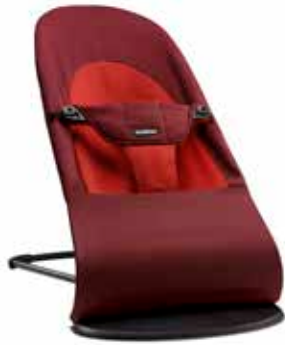
Óxido/Naranja Algodón, 005024