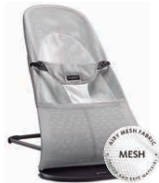
Gris Claro/Blanco Mesh, 005029