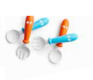
Naranja/Turquesa 4p 072105