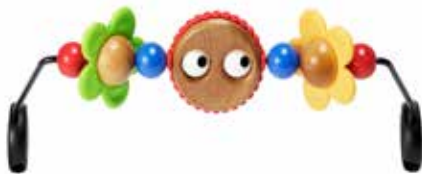
Ojitos Traviesos 080500