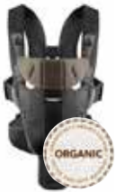
Negro/Marrón Organico, 096047