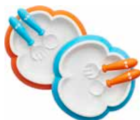
Naranja/Turquesa 2-pack 074082