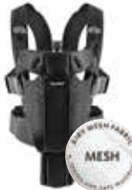
Negro Mesh, 096002