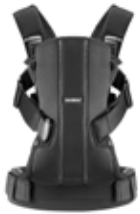
Negro Algodón, 092044