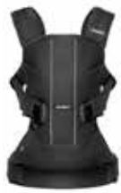
Negro Cotton Mix, 093023