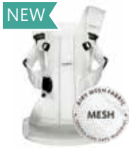
Blanco Mesh, 092044