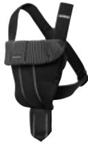
Negro Milrayas Algodón, 023020