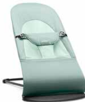
Verde Bosque Algodón, 005076