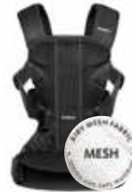
Negro Mesh, 093025