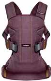
Rojo Zanzamora Algodón, 093077