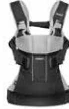
Negro/Plata Algodón, 093065