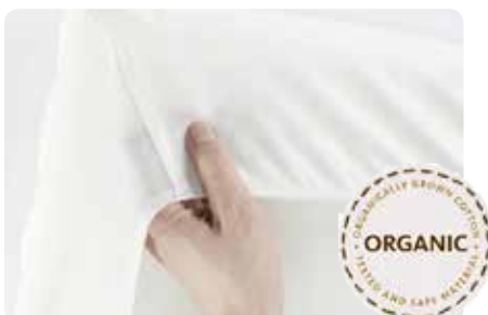
Blanco ecológico, Organic o43o35