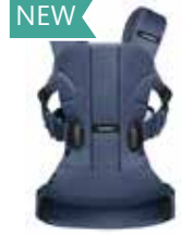
Azul Ballena Mesh, 093008