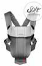
Gris Oscuro/Gris Soft, 023084