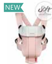
Rosa Claro/Gris Soft, 023089