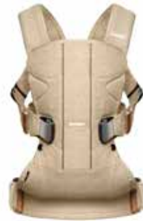
Beige Abedul Cotton Mix, 093078