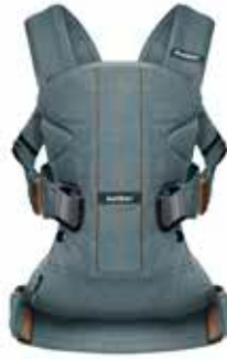
Verde Pino Cotton Mix, 093086