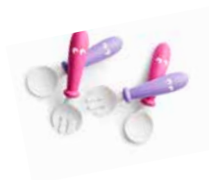
Rosa/Lila 4p 073046