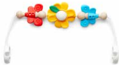
Amigos voladores 080099