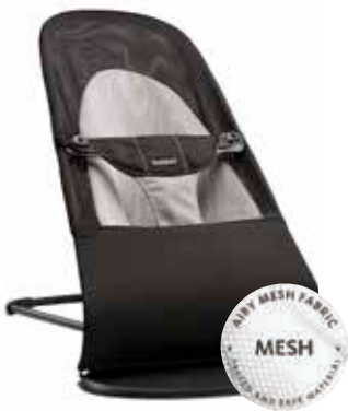
Negro/Gris Mesh, 005028