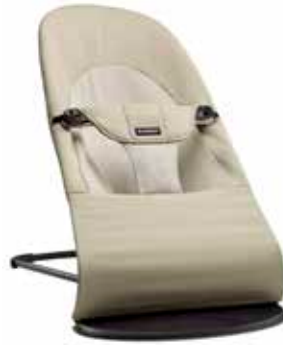
Caqui/Beige Algodón, 005026