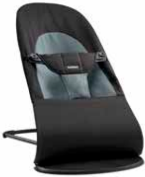
Negro/Gris Oscuro Algodón, 005022