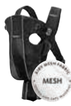
Negro Mesh, 029018