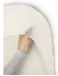
Blanco ecológico, Organic, 047021