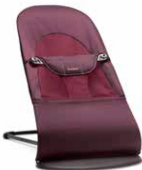
Rojo Ciruela Algodón, 005077