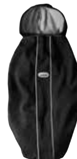
Funda polar para todas las mochilas Negro, 028056