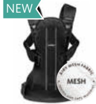
Negro Mesh, 092044