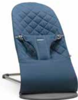
Azul medianoche Algodón, 006015