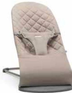
Gris arena Algodón, 006017