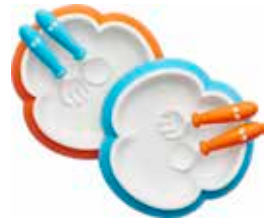
Naranja/Turquesa 2-pack 074082