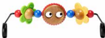
Ojitos Traviesos 080500