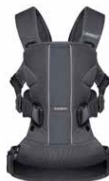
Antarcita Mesh, 093013