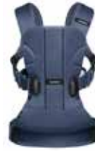
Azul Ballena Mesh, 093008