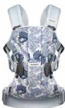
Estampado hojas / Azul Pálido Algodón, 093054