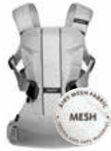
Plata Mesh, 093004