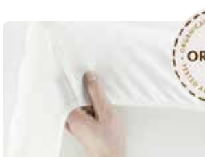
Blanco ecológico, Organic 043035