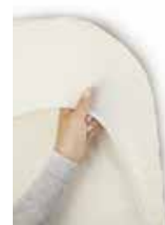
Sábana ajustable para Minicuna