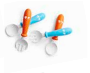
Naranja/Turquesa 4p 073082