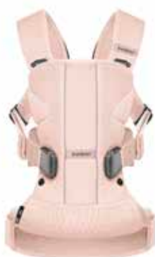
Rosa Pastel Mesh, 093012