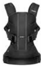
Negro Cotton Mix, 093023