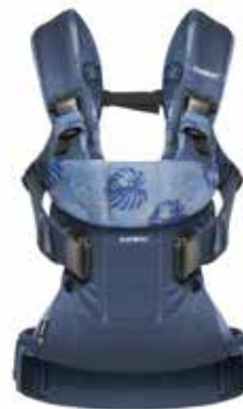
Azul medianoche / Estampado Hojas Algodón, 093052