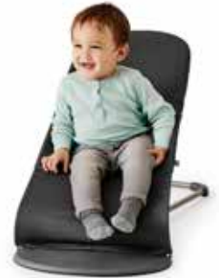
3,5 - 13 kg (0-2 años)