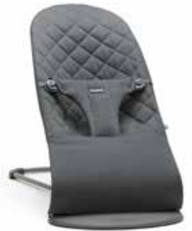
Antarcita Algodón, 006021