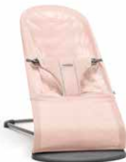
Rosa pastel Algodón, 006012