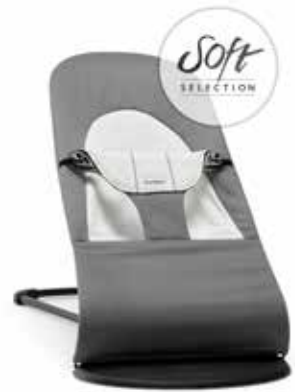
Gris Oscuro/Gris Cotton/Jersey 005084