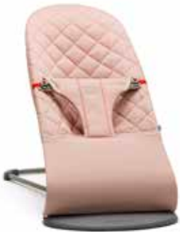
Rosa palo Algodón, 006014