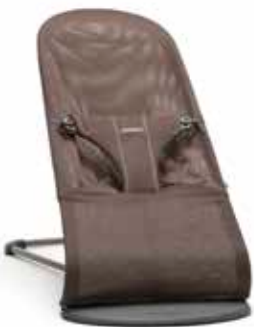
Cacao Mesh, 006011