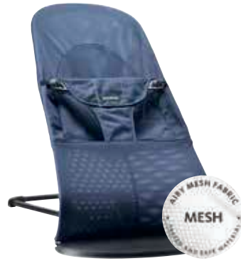
Gran Ballena Azul Cotton/Jersey 005008