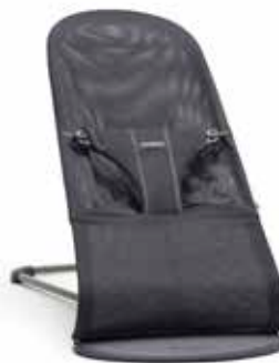
Antarcita Algodón, 006013