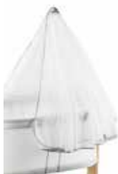
Dosel para Minicuna Blanco, 042021

El dosel suaviza y tamiza la luz, haciendo que la minicuna sea un lugar seguro y tranquilo para dormir. Hecho de un fino tejido de red y bien ventilado.