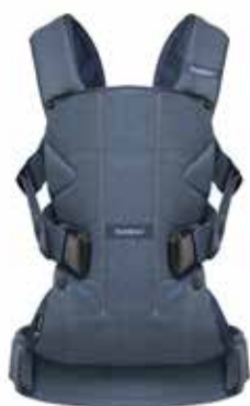
Vaquero clásico/ Azul Medianoche Algodón, 093051