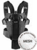
Negro Mesh, 096002