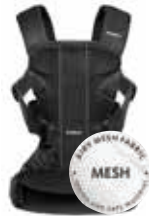
Negro Mesh, 093025