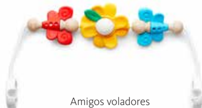
Amigos voladores 080099