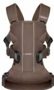
Cacao Mesh, 093011