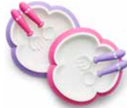
Lila/Rosa 2-pack 074046