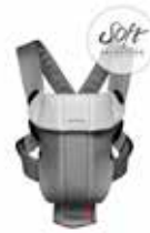
Gris Oscuro/Gris Soft, 023084