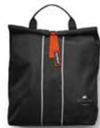
Bolsa para Mochila incluida